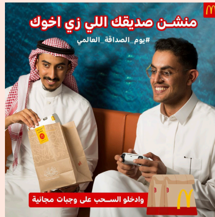
يوم الصداقة العالمي