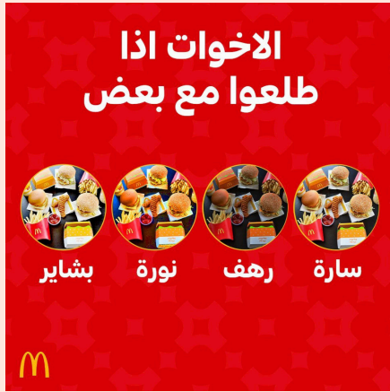
يوم الأخت العالمي