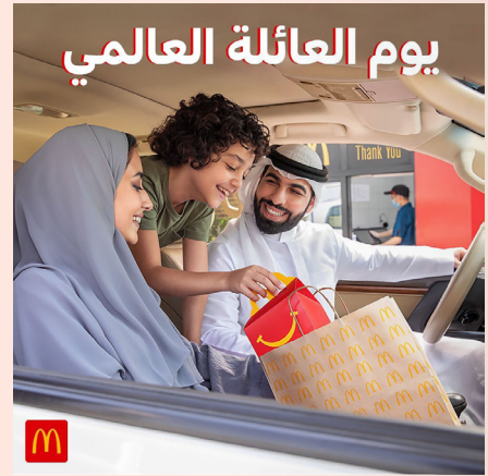
يوم العائلة العالمي