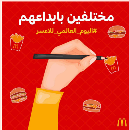
اليوم العالمي للعسر