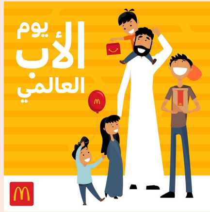
يوم الأب العالمي